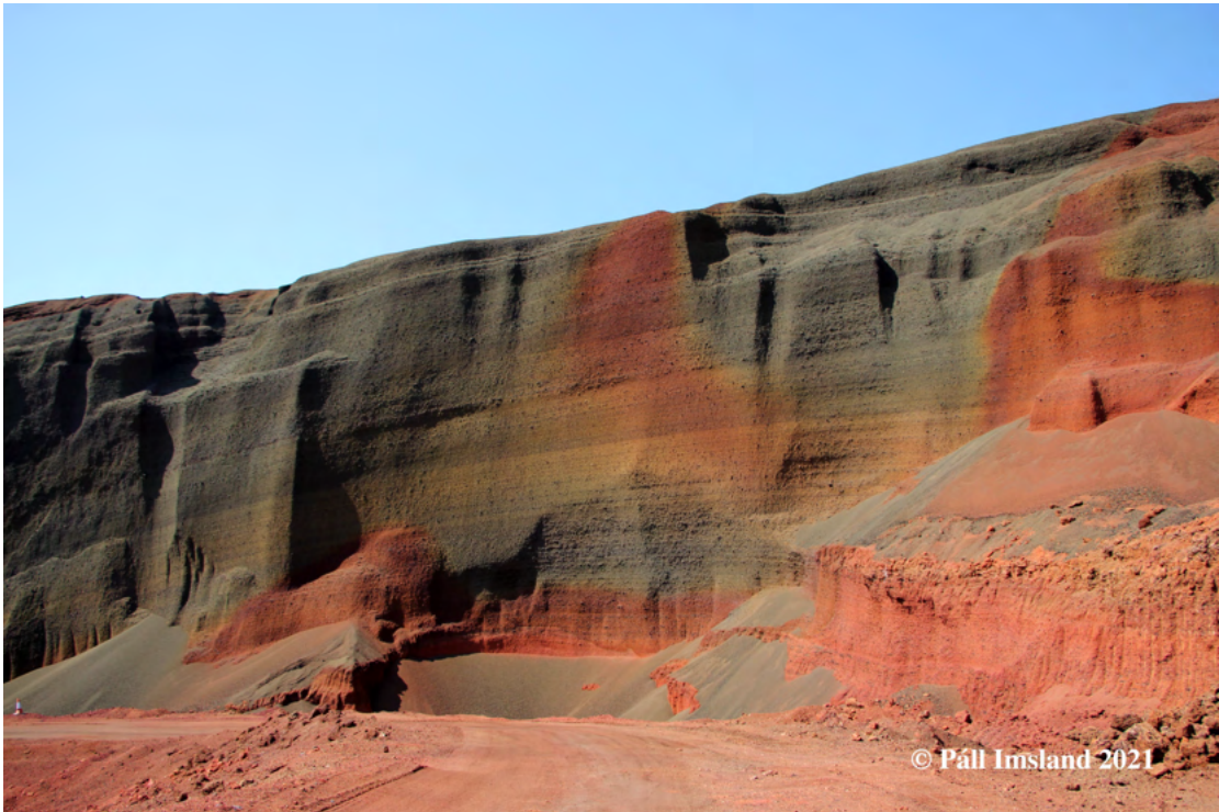
3. mynd: Þegar komið er inn í námu E30b úr Hólaskarði blasa innviðir Seyðishóllanna við í fjölbreyttu litaspili.