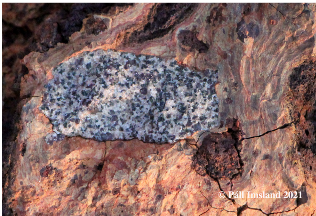
13. mynd: Stakur gabbróhnyðlingur í klepragjalli, ca 4 cm á lengd.