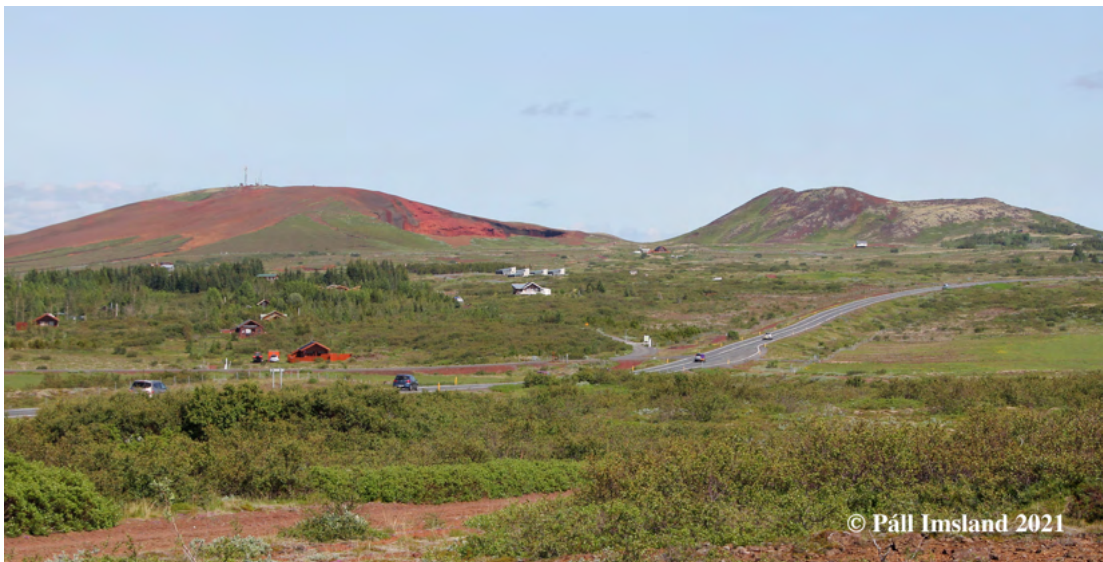
5. mynd: Seyðishólar og Kerhóll séðir frá Kerinu. Mismunandi form þessara tveggja gíga leynir sér ekki.

Gjallið í Seyðishólum er mjög einsleitt að gerð en fjölbreytt að litum, mest í rauðum, grábrúnleitum og bláleitum tónum, sjá 6. mynd. Gjallbrotin eru fremur smá, mest fáeinir cm í þvermál og mjög blöðrótt. Þar sem það er mjög lítið kleprað er gjalluppvarpið sjálf mjög laust í sér, sjá 7. mynd, og þar sem gallið er mjög blöðrótt og því eðlislétt er það auðvelt í námavinnslu, en molnar á hinn bóginn auðveldlega undan álagi og þunga. Klepragjallið myndar stærri samhangandi einingar, klepra, og hrúgast öðru vísi upp í gígveggjunum, sjá 8. mynd, og brotnar niður við námavinnsluna í stærri klumpa og hnullunga.