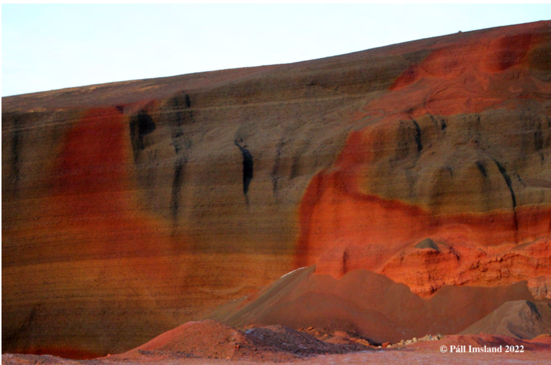
4. mynd: Inni í námunni eru brattir gjallveggirnir mest áberandi í grábrúnum og rauðum litum gjallsins.