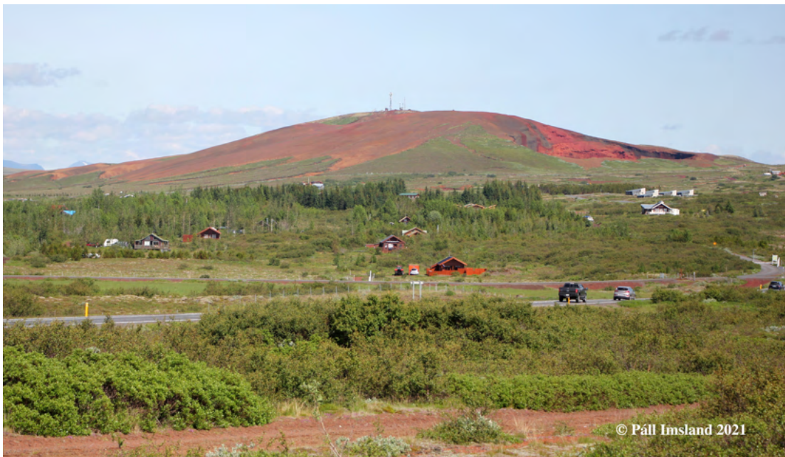
1. mynd: Seyðishólar séðir úr suðvestri, frá Kerinu, að sumri til. Náma E30b sést suðaustan í hólunum.