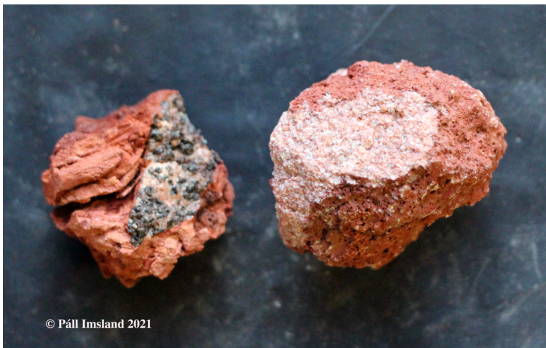
12. mynd: Hnyðlingar af tveim ólíkum gabbróafbrigðum, hefðbundnu gabbrói og ljósu anorþósíti.