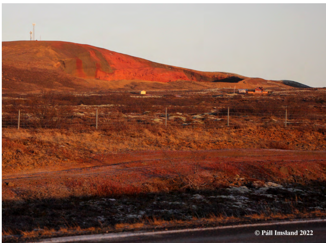
2. mynd: Seyðishólar séðir úr suðri, frá Þjóvegi 35, Biskupstungnabraut, í vetrarbirtu, sér inn í námuna.