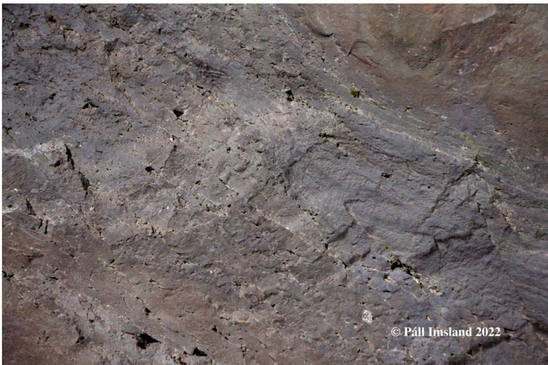
10. mynd: Bergið í Grímsneshraununum er yfirleitt fínkorna, gráblátt og grábrúnleitt, ólivín-basalt fremur snautt af dílum.

Kvikan sem er fremur frumstæð gefur til kynna að hún sé komin af allmiklu dýpi í jörðinni, og fremur beint neðan úr möttli jarðar en úr grunnstæðum kvikuhólfum í jarðskorpunni.