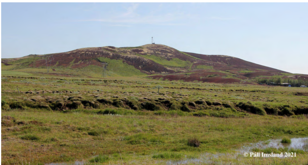
15. mynd: Seyðishólar séðir úr vestnorðvestri. Héðan sjást námurnar í hólunum ekki en hin ávala bunguformaða lögun hólanna er áberandi.

Upprunaleiki: Seyðishólar hafa verið opnaðir í þrem námum og upprunalegt yfirbragð hólanna er þannig horfið. Útliti þeirra sem landslagsforma hefur verið stórlega raskað. Þetta setur Seyðishóla í lágt verndargildi. Þó má enn sjá formgerð hina upprunalegu útlína Seyðishóla ef þeir eru skoðaðir úr vestri (15. mynd). Þaðan sér ekkert til námanna eða þeirrar röskunar sem þær hafa í för með sér á formum gíghólanna. Hér er Seyðishólum gefin einkunn uppá 0,5 fyrir þennan þátt.