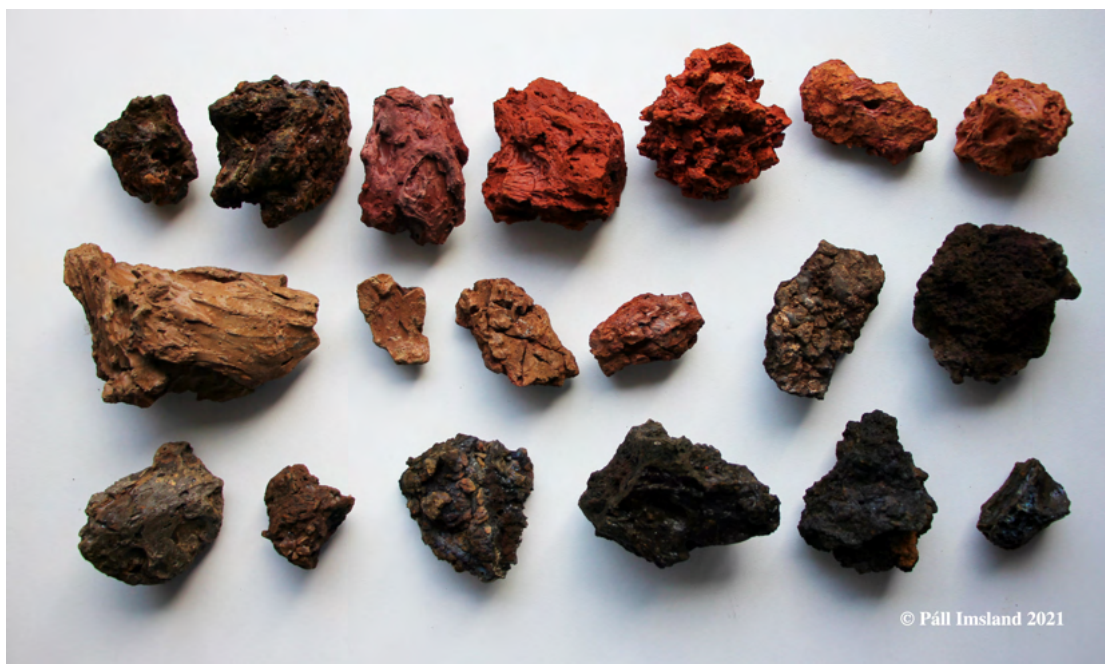
6. mynd: Litaspilið í gjallmolunum í Seyðishólum er mikið þegar þeir eru skoðaðir stakir.