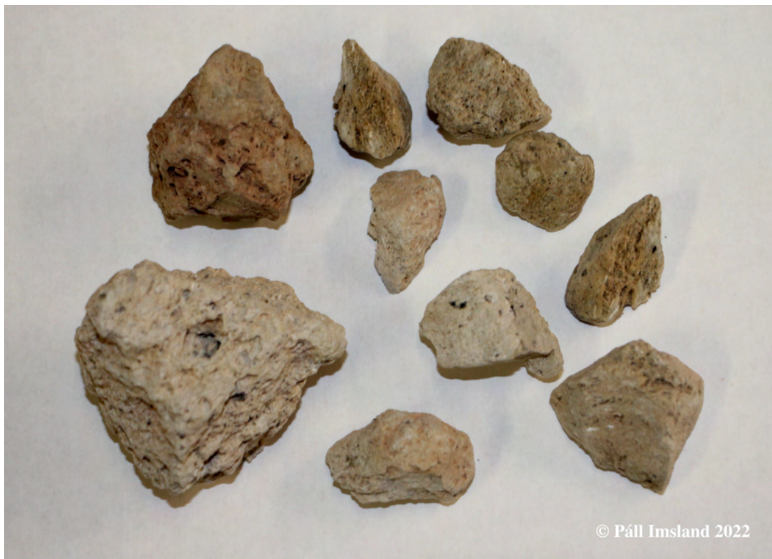
14. mynd: Súrir frauðlingar sem tíndir hafa verið úr gjallinu. Þeir minna afar mikið á Hekluvíkur. Kornastærðin er upp undir 6 cm í þvermál.

Við kristöllum kviku við aðstæður afmarkaðar á þennan hátt er líklegt að eitthvert smáræði af súrri bergkviku verði einnig til. Það er þá restin af kvikunni sem er að storkna og ekki fær aðgang að steindunum sem eru að myndast vegna þess að frumefnin sem enn eru ókristölluð eiga ekki heima í kristalgrindum þeirra steinda sem eru að krisatallast. Slík súr kvika getur líka orðið til í litlum mæli í svona kerfi þegar heit kvika kemst inn í það og í snertingu við heitt berg með lægra bræðslumark og þá bráðnar af því fyrsti skammturinn. Slíkir smáskammtar eru yfirleitt súrir að samsetningu.