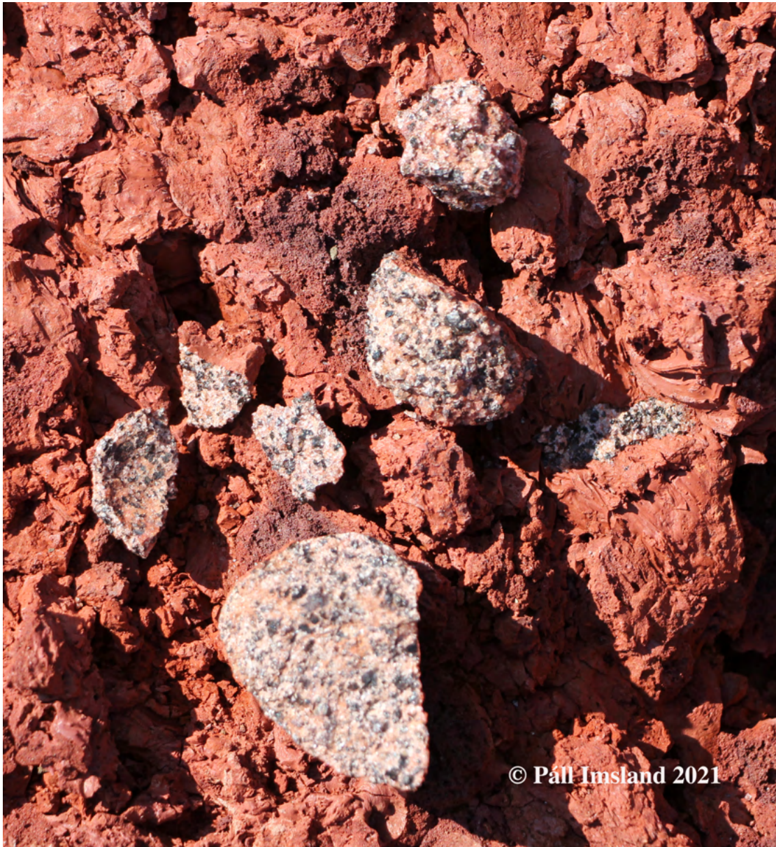
11. mynd: Smáir gabbróhnyðlingar í gjallstáli. Stærð þeirra er upp í nokkra cm í þvermál.

(Kristín Vala Ragnarsdóttir o.fl., 1982, Sveinn P. Jakobsson, 2013). Hinsvegar hafa þeir borist upp á yfirborðið í mun frumstæðari og heitari kviku (um 1200°C) Seyðishólagossins, sem hlýtur að vera komin lengra neðan að og hefur hrifið hnyðlingana með sér á leið um kvikuhólfið. Í gjallinu finnast líka einstöku frauðlingar úr súru gleri, glerfrauði, (Sveinn Jakobsson, 1966) (14. mynd). Það bendir líka til þess að undir svæðinu sé kvika enn að storkna, ef til vill storknandi kvikuhólf eða lagskipt innskot. Þetta kvikuhólf tilheyrandi gömlu Grímsnemeginseldstöðinni er mjög líklega varmagjafi jarðhitans á svæðinu, uppruni koldíoxíðstreymisins og uppspretta bæði súra frauðsins og gabbróhnyðlinganna.